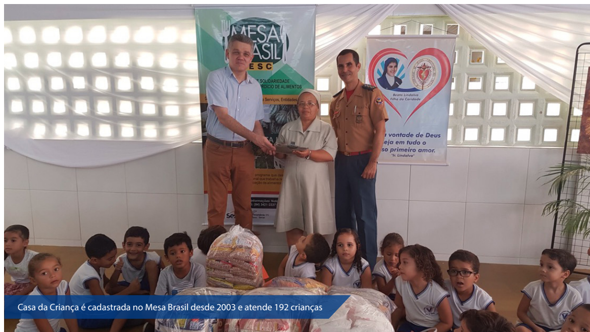
Casa da Criança é cadastrada no Mesa Brasil desde 2003 e atende 192 crianças

Também foram beneficiadas pela doação as seguintes instituições cadastradas no Mesa Brasil: Lar do Ancião Evangélico, Lar da Vovozinha, Instituto Juvino Barreto, Abrigo Bom Samaritano, Associação Nossa Senhora das Dores, Instituto Terapêutico Nova Aliança, Centro Educacional Dom Bosco, Aldeias Infantis, Associação Bethel, Instituto Bom Pastor, Centro Espírita Irmãos do Caminho, Escola Pe. João Maria, Lar Fabiano de Cristo