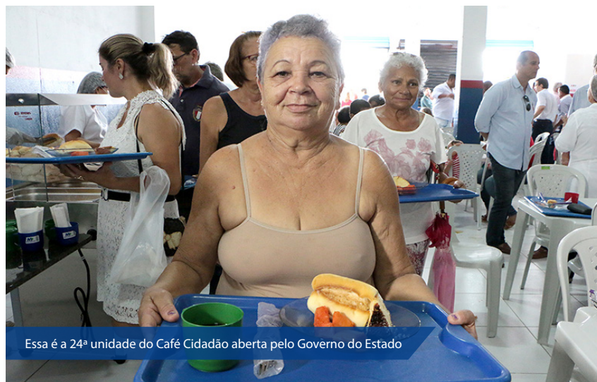
Essa é a 24ª unidade do Café Cidadão aberta pelo Governo do Estado