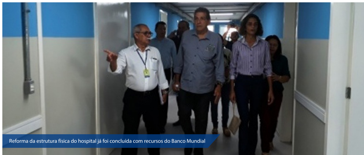
Reforma da estrutura física do hospital já foi concluída com recursos do Banco Mundial