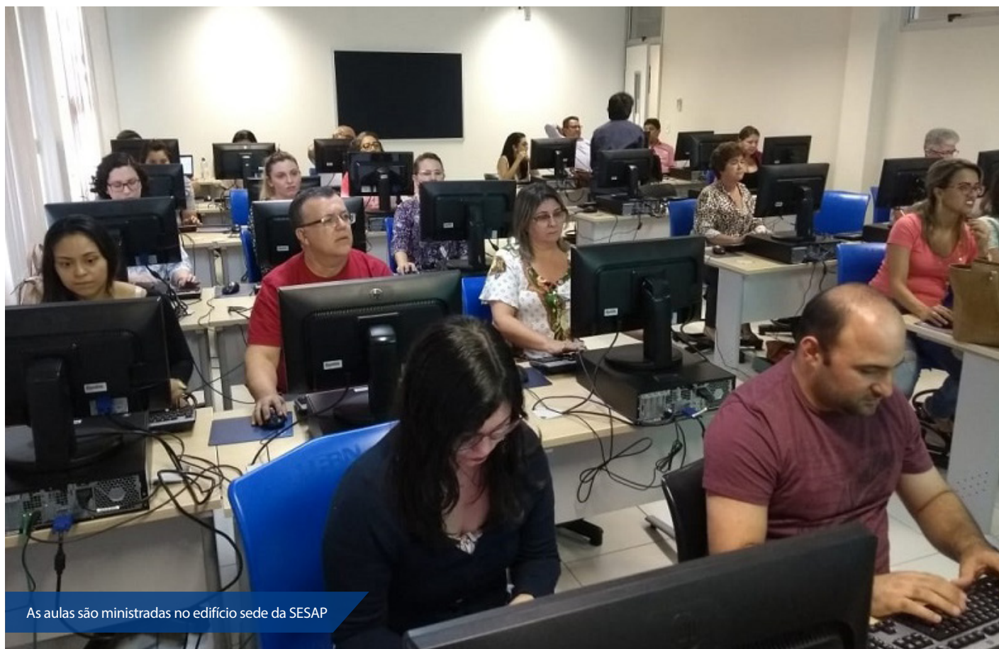
As aulas são ministradas no edifício sede da SESAP

A SESAP está entre os 50 órgãos públicos estaduais que usará o SEI, a ferramenta que permite a tramitação totalmente digital dos processos, diminuindo o uso de papel e tinta para impressão.