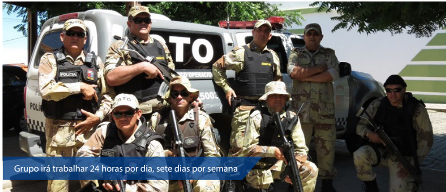
Grupo irá trabalhar 24 horas por dia, sete dias por semana